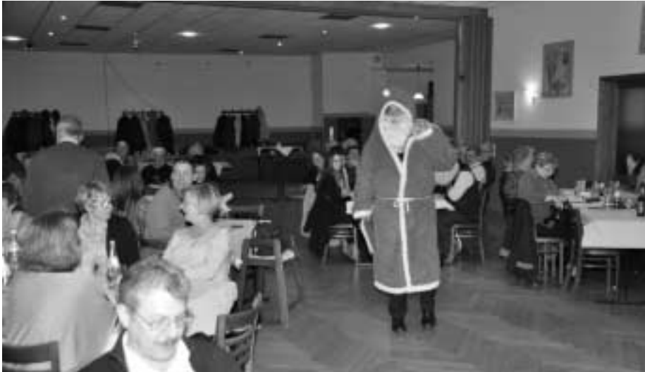
Als Höhepunkt der Weihnachtsfeier zog „Nikolaus Gobbes“ ein

Am Freitag, 16. Dezember 2016 fand im weihnachtlich geschmückten Saal des „Brauhauses zum Stadtpark“ die Weihnachtsfeier der Liedertafelchöre statt.