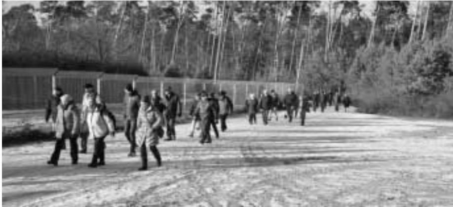
Auf geht's in den Wald

Fest zum Terminplan der Liedertafel gehört die Winterwanderung, die wie fast jedes Jahr obligatorisch am 6. Januar stattfindet. Auch in diesem Jahr wurde diese von unserem Vergnügungsausschuss geplant und vorbereitet. Viele aktive und fördernde Mitglieder des MGV Liedertafel hatten sich für die Winterwanderung angemeldet. Wie schon oben beschrieben, traf man sich am Freitag, 6. Januar 2017, dem Festtag der Heiligen Drei Könige, um 14.00 Uhr auf dem Parkplatz vor der DJK-Sporthalle. Nachdem man sich gegenseitig die Neujahrswünsche überbracht hatte, setzte sich die Wandergruppe in Richtung Motodrom in Bewegung. Das Wetter spielte dieses Jahr auch mit. Bei sonnigem Wetter und 4 Grad Celsius minus war der Boden gefroren und in den Schattenbereichen im Wald lag noch Schnee. Trotzdem ließ es sich den Umständen entsprechend gut laufen.