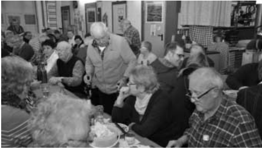
Eingelegte Heringe sind eine Delikatesse