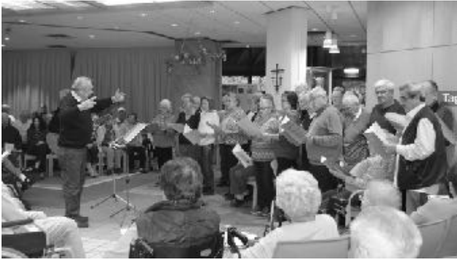
Aufgeheiterte Stimmung verbreitet

Zu einem festen Programmpunkt im Veranstaltungskalender des Altenheimes Sankt Elisabeth, gehört der Besuch der aktiven Senioren der Liedertafel. Am Dienstag, 20. November 2018 war es wieder soweit und die Bewohner fanden sich zahlreich im Foyer ein. Es ist immer wieder eine