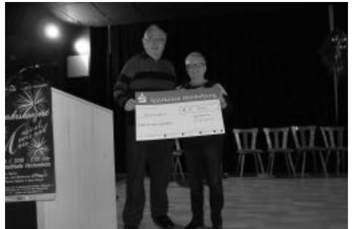
Kinder- und Jugendchor werden in regelmäßigen Abständen mit einer Spende unterstützt

Eines wollen wir zunächst festhalten, es geht hierbei nicht um das aktive Singen im Alter. Natürlich gehört dies in der Gemeinschaft dazu, ist aber nicht das unmittelbare Element. Es geht uns zunächst darum, Gemeinschaft und Gesellschaft zu schaffen. Hieraus erwachsen dann das Angenommen sein und das Angenommen sein in der Gemeinschaft, aber auch die Erkenntnis, jeder sollte sich einbringen mit seinen Fähigkeiten und mit seinen Fertigkeiten. Natürlich ist auch das Zuhören sehr wichtig, denn oftmals wollen Menschen nur einmal ein Gehör finden. So entsteht dann ein Miteinander und ein Füreinander, denn keiner ist allein. Auch wollen wir uns als Brückenbauer betätigen, gerade hin zu unserer Jugend, denn dort wächst unsere Zukunft heran, gerade was das aktive Singen in der Liedertafel betrifft. Die aktiven Senioren unterstützen deshalb in regelmäßigen Abständen den Kinder- und Jugendchor mit einer Spende. Auch haben wir schon an alle Kindergärten von Hockenheim Liederkalender von der Stiftung „Singen mit Kindern“ kostenlos verteilt. Die Liederkalender sind zeitlos und bei jedem Monat ist ein Kinderlied dabei.