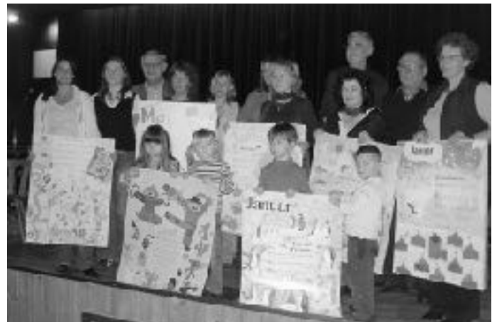
Liederkalender von der Stiftung „Singen mit Kindern“ an alle Kindergärten von Hockenheim kostenlos verteilt