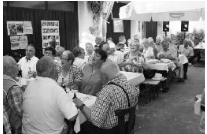
Gemeinsame Ausflüge in geselliger Runde