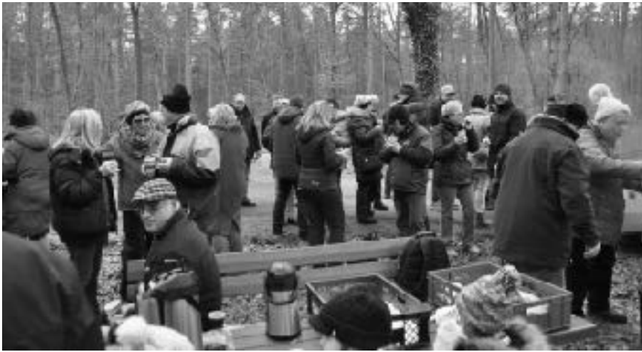
Stärkung mit Glühwein und Brezeln

Das Jahr hat noch nicht richtig begonnen und schon wirft das Hockenheimer Stadtjubiläum zur 1250 Jahrfeier seine Schatten voraus. Durch die vielen Veranstaltungen und dem Neujahrskonzert unseres kulturellen Brudervereins des Fanfarenzuges der Rennstadt Hockenheim entschied sich der Vergnügungsausschuss seine traditionelle Winterwanderung um eine Woche nach hinten zu verlegen.