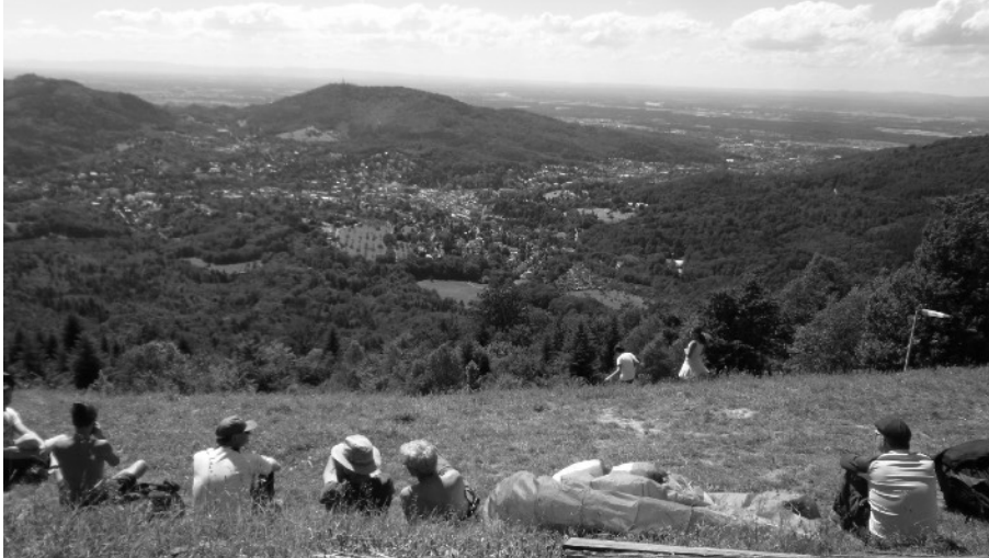
Einen faszinierenden Rundblick bot der Baden-Badener Hausberg Merkur in 668 m Höhe

Der Wettergott strahlte mit den 72 Teilnehmern um die Wette, als die Reiseleiter Beppo Hinterleitner und Klaus Transier den Startschuss zu dem diesjährigen Halbtagesausflug der aktiven Senioren nach Baden-Baden am Donnerstag, 13. Juni 2019 gaben.