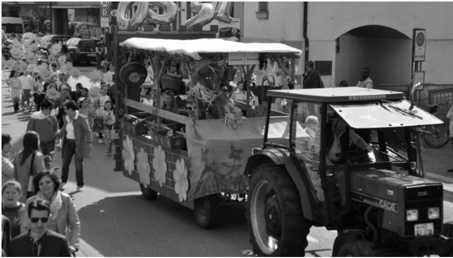
Mit Motivwagen „Herbst“ die Zuschauer erfreut

Am Sonntag, 7. April 2019 führte die Große Kreisstadt Hockenheim bei wettertechnisch gutem Wetter zum 26. Mal den zur Tradition gewordenen Sommertagszug durch. Organisiert wurde der Umzug vom Hockenheimer Marketing Verein e.V. Weit über 1000 Kinder und Erwachsene Begleiter nahmen auf dem Marktplatz Aufstellung. Angeführt vom Fanfarenzug der Rennstadt Hocken-