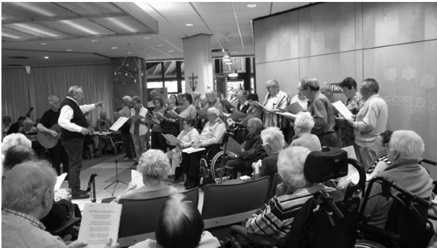
Gemeinsames Singen mit den Bewohnern des Altenheimes

Zweimal im Jahr besuchen die aktiven Senioren der Liedertafel die Bewohner des Altenheimes Sankt Elisabeth, um gemeinsam mit ihnen zu singen. Es ist immer schön mit anzusehen, wie die Bewohner sich auf diese Auftritte freuen.