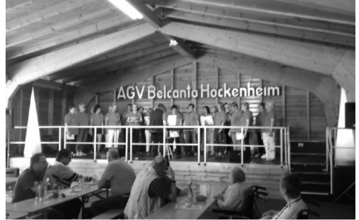
Den Geschmack des Publikums getroffen

Danach saß man noch einige Zeit beim Bazar fröhlich zusammen bei gutem Essen und Trinken.