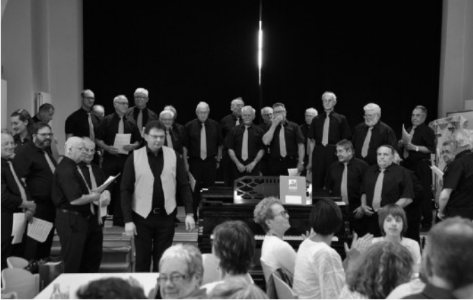
Die Besucher beim Bazar bestens unterhalten

Am Sonntag, 5. Mai 2019 präsentierte sich der Männerchor der Liedertafel Hockenheim wieder einmal beim Bazar der katholischen Kirchengemeinde und wie immer war der Saal des Gemeindezentrums St. Christopherus bis auf den letzten Platz besetzt.