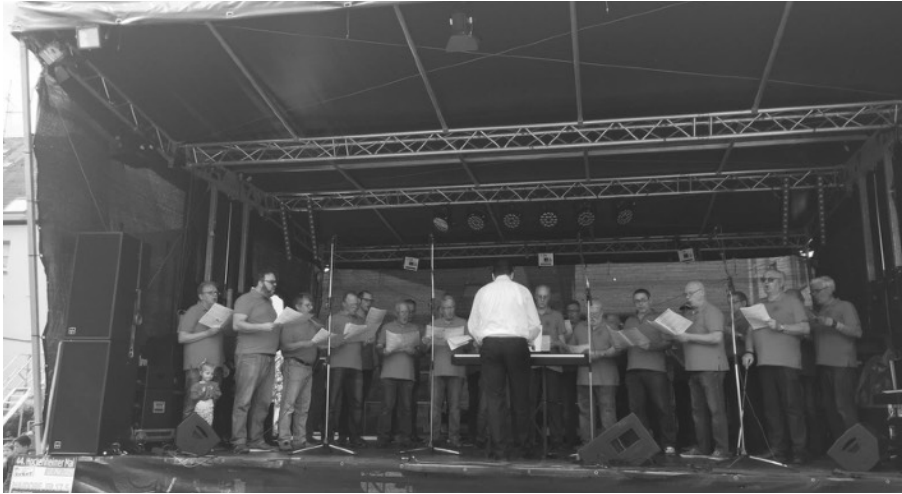
Die Besucher im Maidorf bestens unterhalten

Am Freitag/Samstag, 17. Mai/18. Mai 2019 fand der diesjährige Hockenheimer Mai statt.