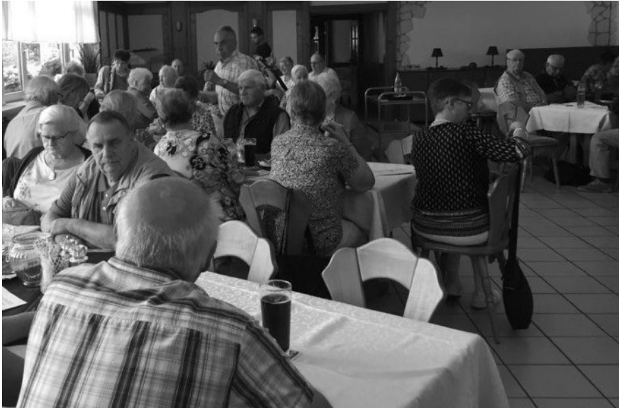
Die vorbereiteten Tische waren gut besetzt