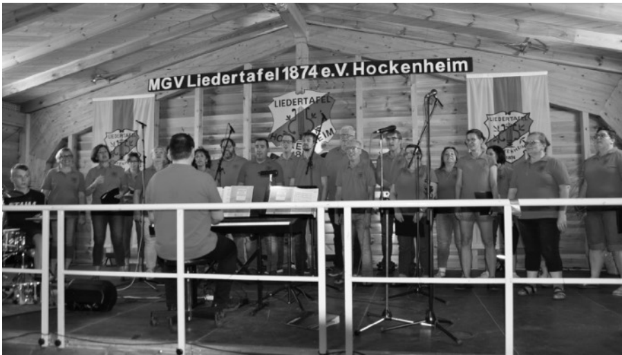
CHORios unterhält mit modernem Liedgut die Besucher

Für das traditionelle Waldfest des Männergesangsverein Liedertafel in die Waldfesthalle im alten Fahrerlager hatte Petrus auch in diesem wieder tolles Wetter mit viel Sonnenschein in seinem Angebot. Die Liedertafel hatte zahlreiche Gäste aus Nah und Fern eingeladen und so war der Waldfestplatz am dritten Wochenende im Juli immer sehr gut mit Besuchern gefüllt. Viele musikalische und kulinarische Leckerbissen machten die Veranstaltung zu einem tollen Erlebnis.