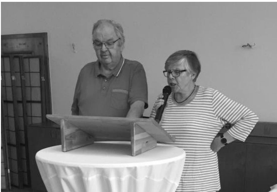
Zwiesgespräch in Reimform zum montäglichen Singstundenbesuch

Die Aktiven Senioren hatten wiederum am Donnerstag, 12. September 2019 zum Sommerfest eingeladen und zwar in die VfL-Gaststätte in der Waldstraße. Dieses Sommerfest wird gerne angenommen, denn die vorbereiteten Tische waren gut besetzt, ein unterhaltsames Programm wurde von den Verantwortlichen dargeboten und des Weiteren