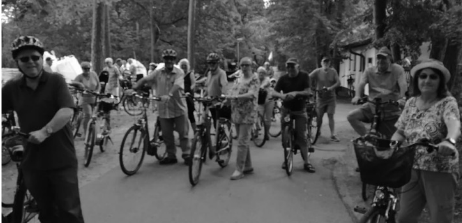
Aktive Senioren besuchten per Rad den Tierpark Walldorf

Großartiges Sommerwetter herrschte und ein wunderschöner Nachmittag begrüßte am Donnerstag, 18. Juli 2019 alle Teilnehmer der Aktiven Senioren zu der diesjährigen Radtour mit Treffpunkt am Haus der Feuerwehr in der Heidelberger Straße. Eine muntere Schar kam zusammen.